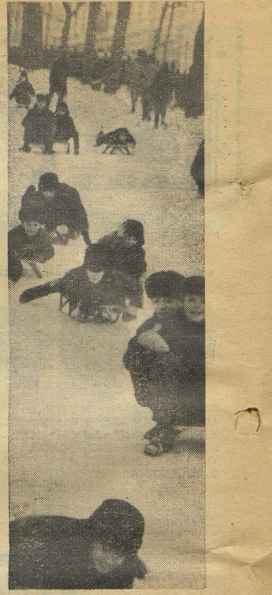
В зимние каникулы.

Эта «Пионерская республика» носила имя Вильгельма Пина. В ней отдыхают ребята из разных стран. Рассказы записал Ю. ПЕСИКОВ.